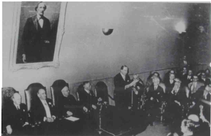
Acto de homenaje a Mitre realizado el 11 de diciembre de 1937. Inauguración del salón de conferencias históricas del Museo Mitre, en donde la Junta y luego la Academia celebraron sus sesiones públicas hasta 1971.