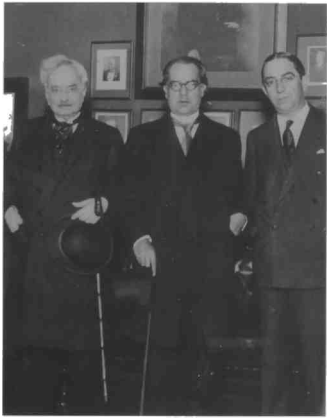
Ramón J. Cárcano, Ricardo Rojas y Ricardo Levene antes de iniciarse una conferencia en la Junta.

neidad y la calidad de la asociación que daba empuje a este "gran laboratorio" veía los motivos principales de esa permanencia y de aquella distinción que Ricardo Levene había impulsado con decisión hasta convertir a la Junta en un organismo intelectual de crédito y fama en la República y en el exterior.